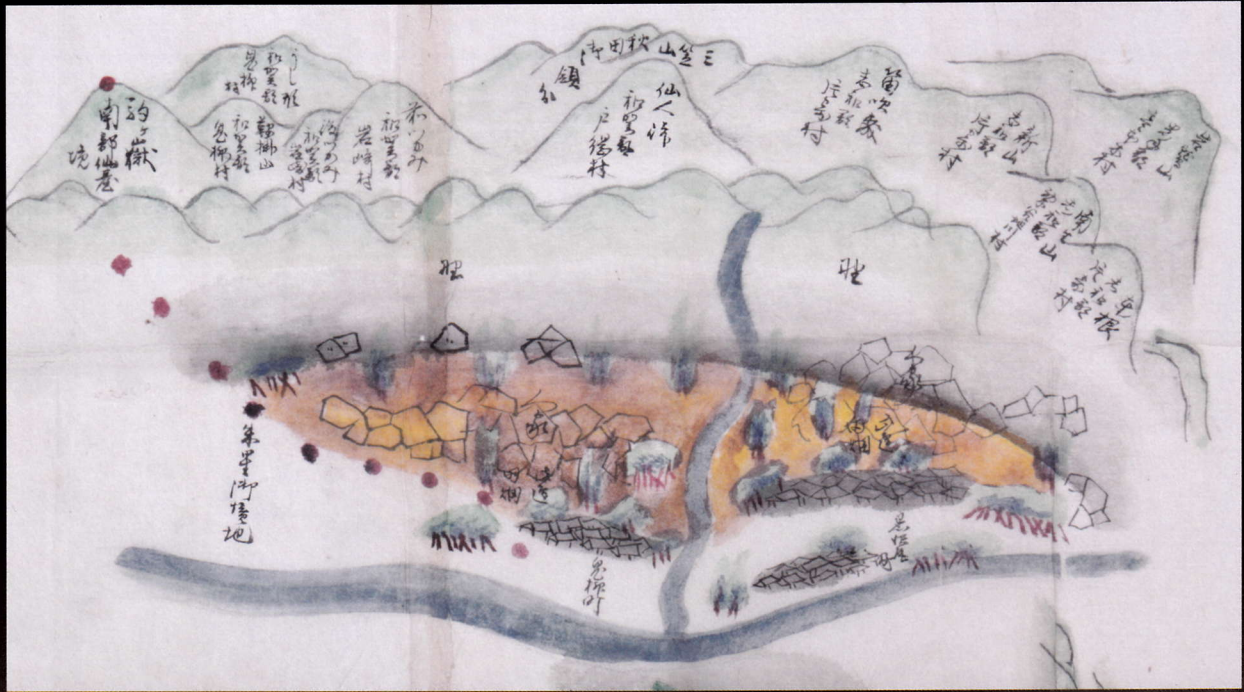
「江刺郡下門岡村国見山御遠見南部御領御絵図」文政5年（1822）