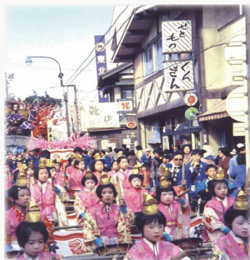
火防祭(昭和48年[1973])