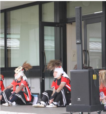
■ 芸能公演で活躍する音響機材