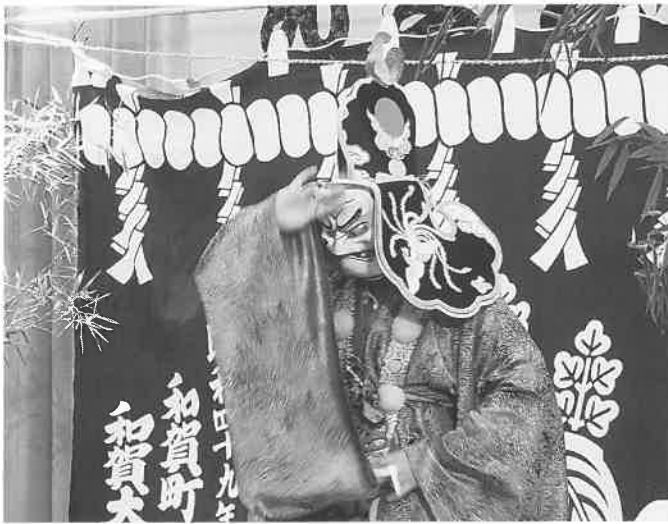
病魔退散の舞「薬師」

11月22日(日)第26回大乘神楽大会が開催されました。新型コロナウイルス感染症のため、日程を6月から11月に延期し、鑑賞者を50名に限定しました。また、一部の出演者はマスクやフェイスシールドを着けた状態で出演するなど、感染症対策を徹底したうえで開催しました。例年の大会と異なる様相となりましたが、市内の大乘神楽団体6団体、市外大乘神楽団体1団体が出演し、力強く優雅な舞を7演目披露しました。