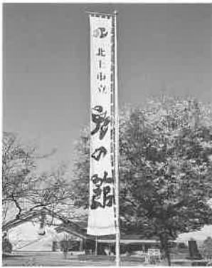
青空に映えるのぼり旗

二つ目は県道からの入り口に掲げている大のぼり旗を新調しました。全長が8mを超えるビッグサイズのはぼり旗は、花巻市の染物屋(株)小彌太さんをお願いして作っていただきました。「鬼の館」の文字も迫力あるものになりました。