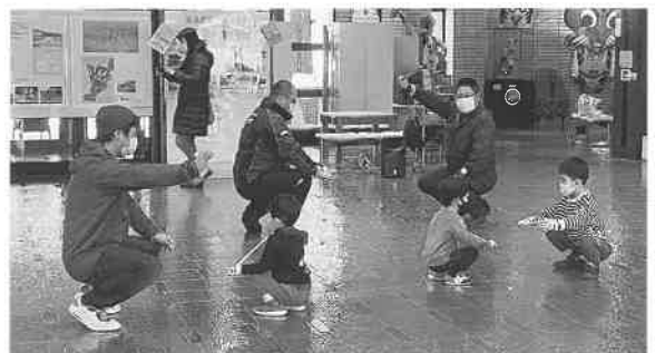
一人一人に優しく指導

体験会では、岩崎鬼剣舞保存会の先生方が、子ども一人一人に優しく丁寧に指導し、みるみる上達していきました。講座最後のまとめの踊りになると、ちょっぴり緊張しながらも先生方と楽しく踊ることができました。