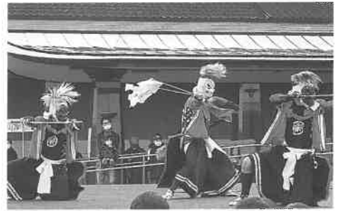
こけら落とし公演 二子鬼剣舞保存会

一つ目は毎月の芸能公演の舞台となっている屋外ステージです。開館から26年を経て表面に痛みが目立っていたので、1か月をかけて全面張り替え工事を行い、これまでのゴムチップ舗装から陸上競技場などで使用される最新のウレタン舗装に生まれ変わりました。12月6日(日)には二子鬼剣舞保存会によるこけら落とし公演を行いました。以前よりも踊りやすくなったのではないのでしょうか。