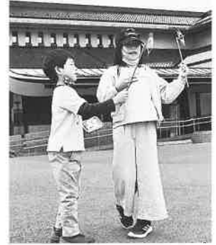
工作完成！ よく回るね！

検温や消毒などの感染対策はもちろんですが、イベントの内容も大きく変わりました。毎年行っていたいくつかの体験活動も「工作教室」（協力：北上少年少女発明クラブ）と「お面に色塗り」の二つに絞り、定員制、全予約制としました。予約をしていないお客様にも楽しんでいただくために、鬼剣舞の塗り絵や楽しいペーパークラフトのお土産を準備しました。また、展示室を巡りながら鬼の秘密を探るクイズラリーに挑戦する家族もたくさんいました。今年の見玉は「コスプレでGO!」（広報きたかみで周知）。家からコスプレしてきた子どもたちがフォトスポットで写真を撮って楽しんでいました。規模縮小ではありましたが、来館者の皆様に楽しんでいただけたイベントになりました。