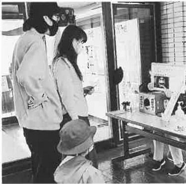
クイズラリーに いざ出発！

例年、1,000人前後のお客様で賑わう館内、今年は200人ほどとだいぶ少ないのですが、この状況下では仕方のないこと。しかし館内は落ち着いた雰囲気、子どもの日のイベントを楽しむ親子の笑顔がたくさんありました。