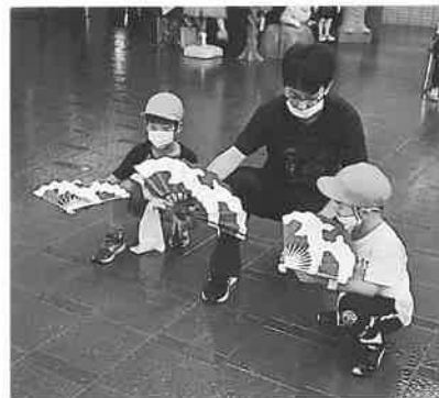
扇はこう！ 足はこうするんだよ！

今年の受講生は4人でした。募集の時期とコロナ感染拡大の時期が重なったため、応募が少なかったのかもしれませんが、しかし集まった4人は鬼剣舞に夢中の子どもたちでした。指導者である岩崎鬼剣舞保存会の先生たちの教えを受けみるみる上達していきました。発表会当日、紋付袴姿のオカドが演奏する中で、衣装を身に付けた子どもたちは元気いっぱい踊ることができました。