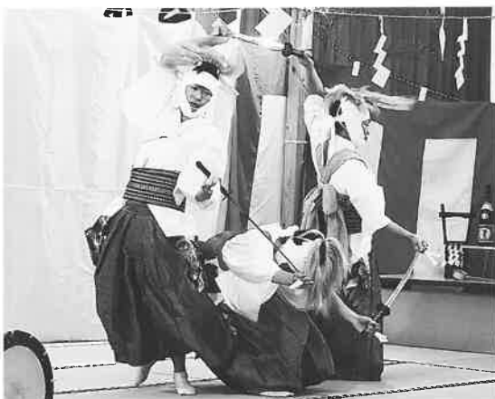
築館大乘神楽「七五三切」

築館大乘神楽保存会による「七五三切」では三人の舞い手が互いの刀を持ちながら、激しく舞います。刀で作った輪を飛び越えたり、潜ったりするなど、アクロバティックな所作に会場から暖かい声援が送られました。