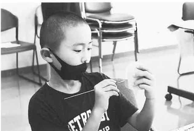
はみ出さないように丁寧に塗ります

真っ白な風鈴に絵の具を塗り、装飾をつけて作ります。自分の好きな色の絵の具や、装飾に使うパンコールを選ぶところが楽しかったようです。短冊には「コロナがいなくなりますように 疫病退散」や「コロナたいさくをしよう」など思い思いの言葉やイラストを描きました。目を輝かせながら作業を進める姿がとても印象的でした。