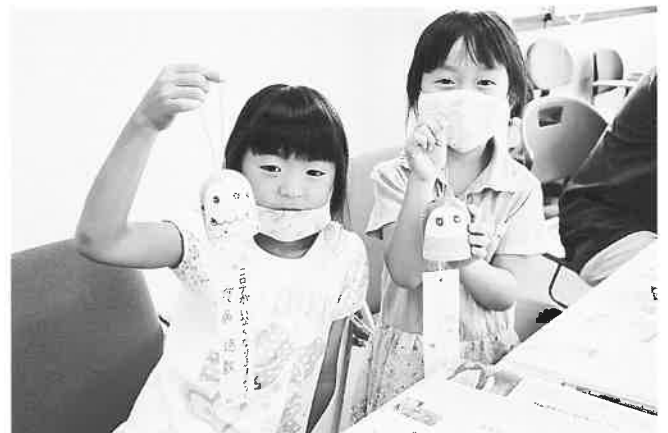
みなさんの思いが届きますように