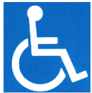
障害者のための国際シンボルマーク