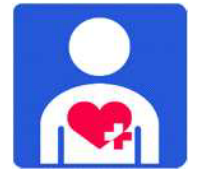
ハートプラスマーク 内部障がいのある方を表すマーク