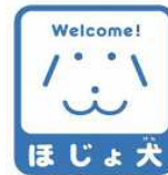
ほじょ犬マーク 盲導犬・介助犬・聴導犬の同伴を啓発するマーク