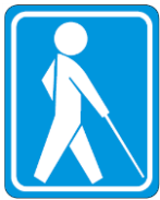
盲人のための国際シンボルマーク