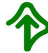
耳マーク 聴こえが不自由なことを表すマーク